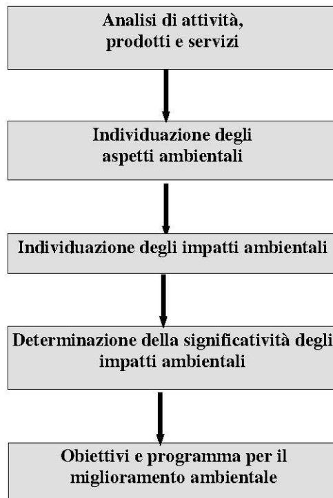
Fig. 1 -Diagramma di flusso attività di verifica della documentazione acquisita